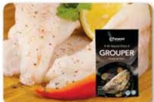
Filete de Mero Panamei Congelado - 12 oz Reg. $9.85