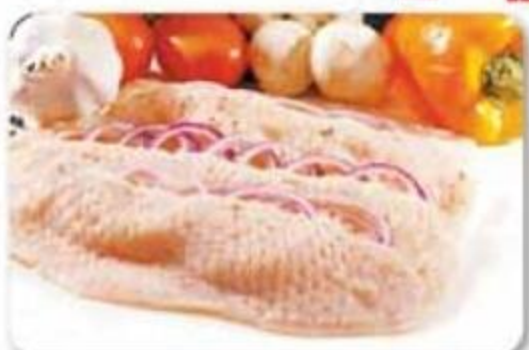
Biftec de Pechuga de Pollo Estados Unidos Previamente Congelado Reg. $2.89 lb