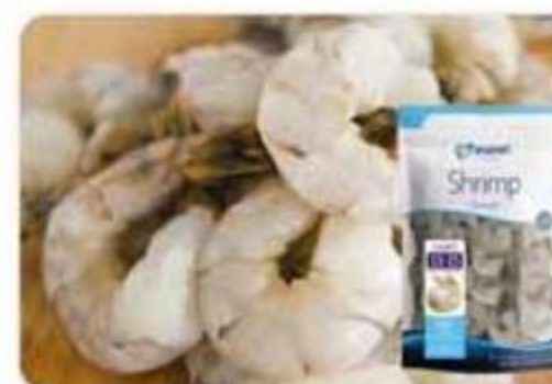
Camarones Crudos Panamei Congelados - 13/15 12 oz - Reg. $6.85