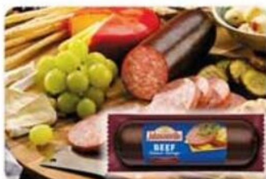
Beef Summer Sausage Johnsonville 12 oz - Reg. $7.15