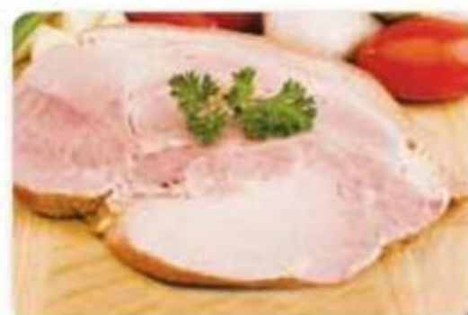
Jamón de Cocinar Mr. Ham - Canadá Con Hueso Reg. $4.69 lb