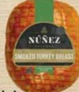
Smoked Turkey Breast Núñez Reserve Reg. $7.35 lb