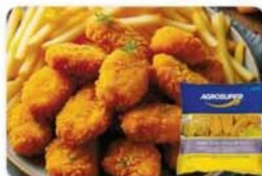
Chicken Nuggets, Strips o Patties Agrosuper Congelados - 24 oz Reg. $5.99 cu