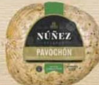
Pavochón Núñez Reserve Reg. $6.59 lb