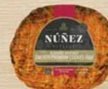
Jamón Serrano Núñez Reserve Reg. $5.35 lb