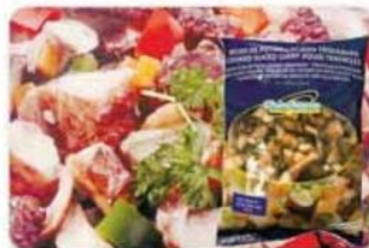
Pulpo Cocido Chinchorro Congelado - Imitación 2 lbs - Reg. $15.59