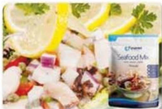
Sea Food Mix Panamei Congelado - 1 lb Reg. $4.25