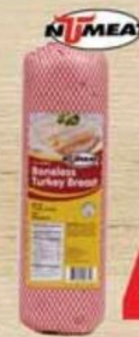
Jamón de Pechuga de Pavo Numeat Reg. $6.07 lb