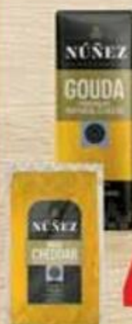
Queso Núñez Reserve Gouda o Cheddar Rebanado Reg. $5.15 lb a $5.55 lb