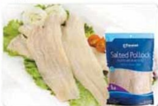
Filete Pollock Panamei 1 lb - Reg. $4.15 cu