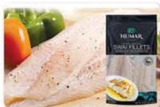
Filete de Swai Numar Congelado - 1 lbs Reg. $3.59