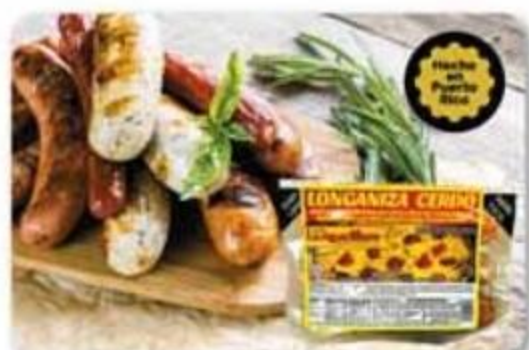
Longaniza (variedad) o Chorizo La Aguadillana 1 lb Reg. $4.89 cu o $5.69 cu