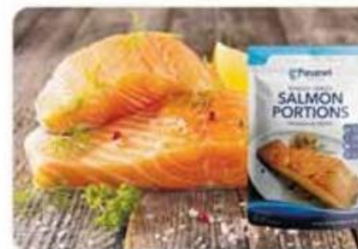
Salmón en Porciones Panamei Congelado - 1 lb Reg. $6.79