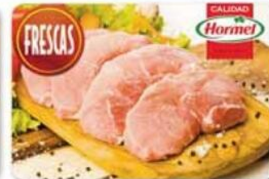
Chuletas Deshuesadas de Cerdo Sirloin Estados Unidos Primer Corte - Reg. $2.99 lb