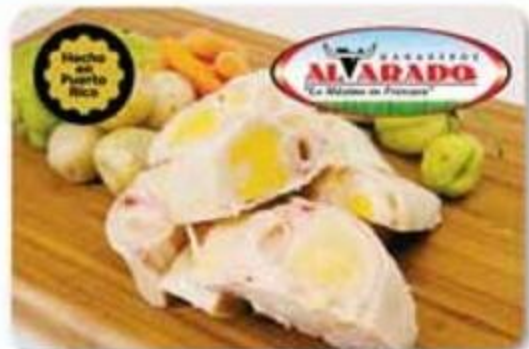
Pata de Res Puerto Rico Congelada - Reg. $1.79 lb

• CARNES • • CARNES • • CARNES • • CARNES •