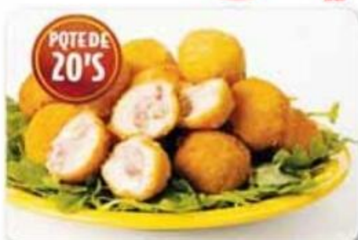
Mini Cordon Blue de Pollo Estados Unidos Congeladas - Reg. $7.99