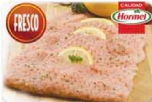
Biftec de Cerdo Machacado Hormel Reg. $3.35 lb