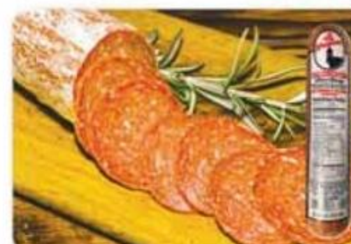
Salchichón La Primera 1 lb - Reg. $6.49