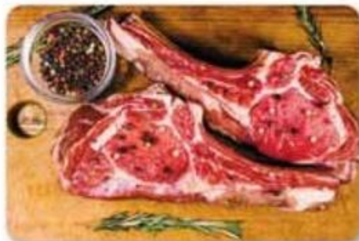
Tomahawk Steak Nicaragua Previamente Congelado Reg. $9.99 lb