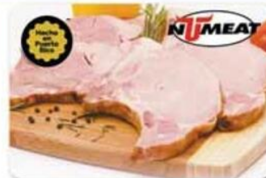
Chuleta de Jamón Ahumada Numeat Reg. $3.15 lb