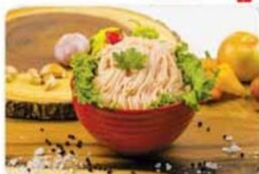
Carne Molida de Pavo Carolina Turkeys Congelada - 1 lb Reg. $4.85