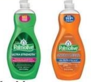
Líquido para Fregar Palmolive Variedad De 20 oz.