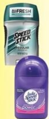
Desodorante Roll-On Speed Stick Men o Lady Variedad De 1.4 oz. a 1.8 oz.