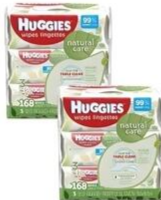
Baby Wipes Huggies Variedad Pqta. de 3 De 56 ct. a 122 ct.