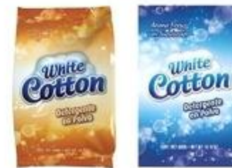
Detergente en Polvo White Cotton Variedad De 400 gr