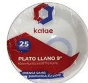
Plato de Foam Katae De 9"/25 ct.