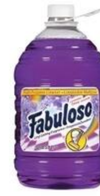
Limpiador Fabuloso Variedad De 169 oz.