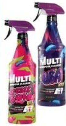
PH Multi Purpose Cleaner Bubble Gum o UBA De 32 oz.