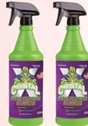
Cristal X Multi Purpose Cleaner De 32 oz.