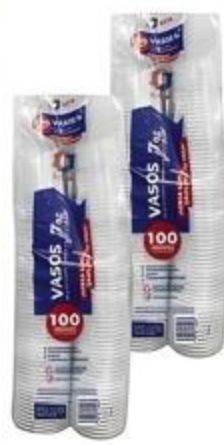
Vasos Katae De 100/7 oz.