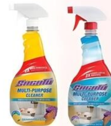
Sacato Multi Purpose Regular o Lemon De 32 oz.