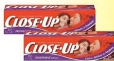
Pasta Dental Close-Up Variedad De 4.0 oz.