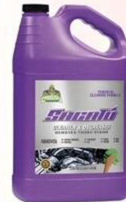
Engine & Machinery Cristal Sacato Xtreme De 128 oz.