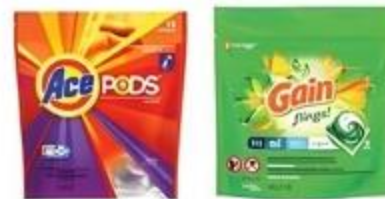
Pods Ace o Ariel o Flings Gain Variedad De 12 ct. a 16 ct.