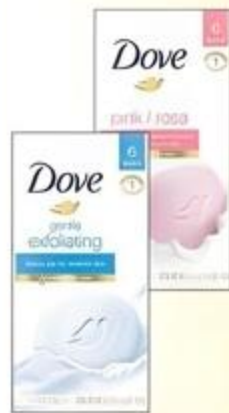
Jabón en Barra Dove Variedad De 6/3.75 oz.