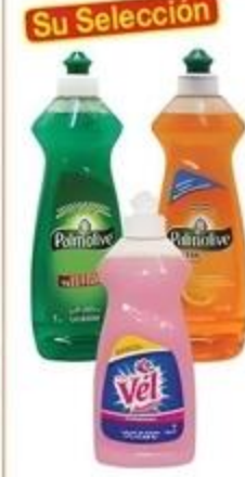
Líquido para Fregar Vel De 10 oz. o Palmolive Variedad De 12.6 oz.