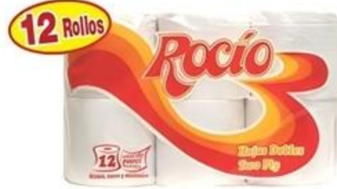
Papel Sanitario Rocio Extra De 12 Rollos