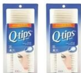
Palitos de Algodón Q Tips De 300 ct.