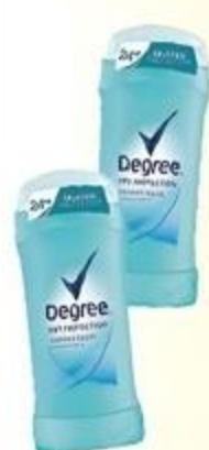
Desodorante en Barra Degree Variedad De 2.6 oz. a 2.7 oz.