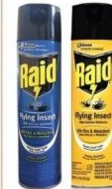
Insecticida Raid Moscas y Mosquitos Variedad De 11 oz.