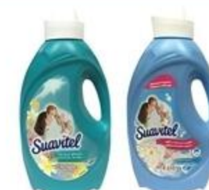
Suavizador Suavitel Variedad De 46 oz. a 64 oz.