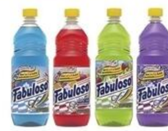
Limpiador Fabuloso Variedad De 28 oz.