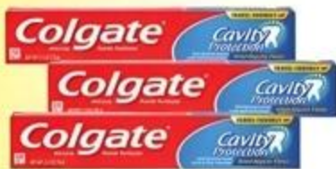
Pasta Dental Colgate Variedad De 2.5 oz.