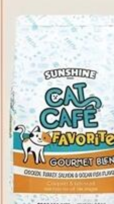
Comida para Gatos Cat Café De 3 Lbs.