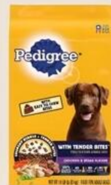
Comida Seca para Perros Pedigree Adulto Variedad De 14 Lbs.