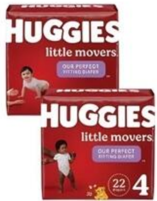
Pañales Huggies Jumbo Variedad De 21 ct. a 44 ct.