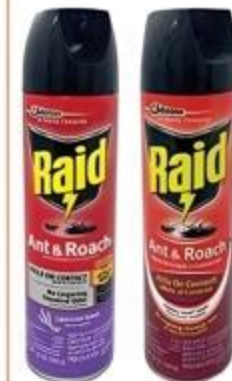
Insecticida Raid Hormigas y Cucarachas Variedad De 12 oz.