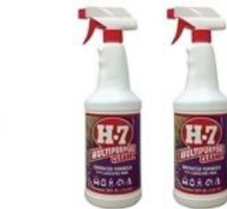
H-7 Degreaser Variedad De 36 oz.