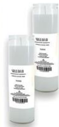
Velón Blanco Soledad De 1 Unid.