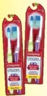
Cepillo Dental Colgate Plus Soft o Medium Pqta. de 2