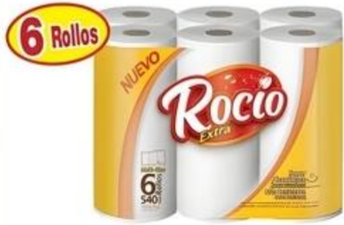
Papel Toalla Rocío De 6 Rollos