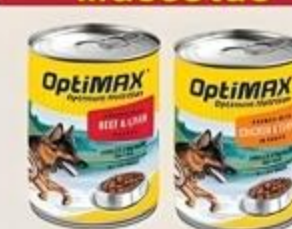
Comida para Perros Optimax Variedad De 13.2 oz.