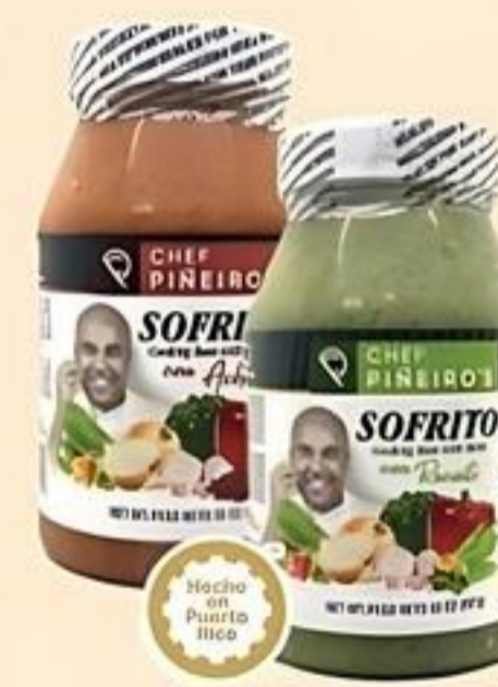
Chef Piñeiro's Sofrito Variedad Env. de 32 oz. Reg. $3.89 c/u