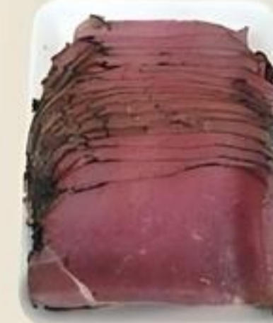
Cherry Hill Pastrami de Res De Estados Unidos Rebanado Reg. $5.99 Lb.