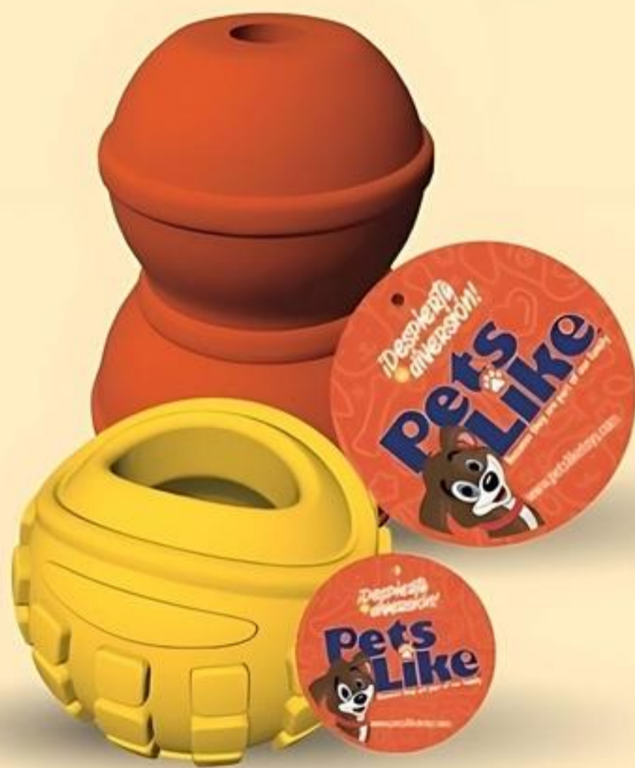
Pets Like Juguetes para Mascotas Variedad Reg. $4.69 c/u