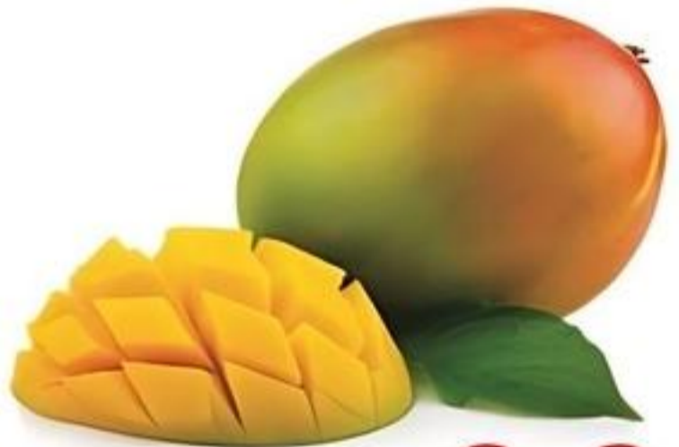
Mangó De Puerto Rico Reg. $1.29 Lb.