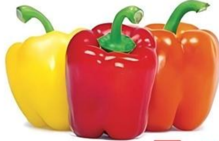
Pimiento Tricolor De México/Estados Unidos Pqte. de 3 Reg. $3.99 Pqte.