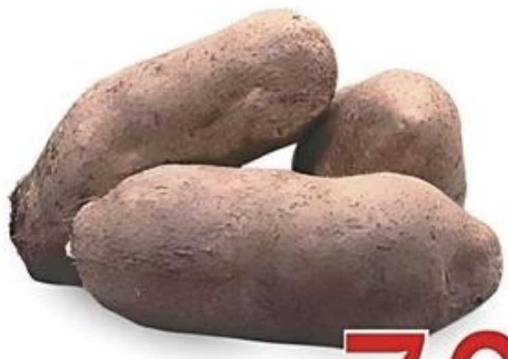
Name Florida De Colombia Reg. $1.19 Lb.