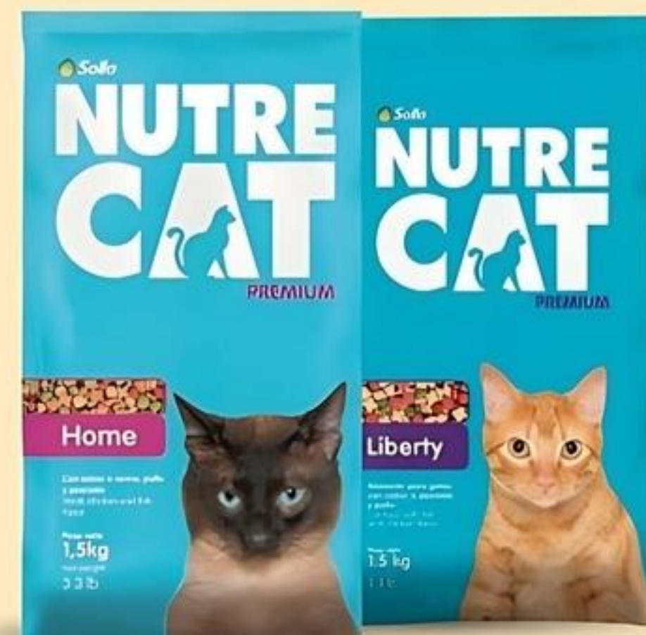
NutreCat Home, Liberty Pqte. de 3.3 Lbs. Reg. $6.49 c/u