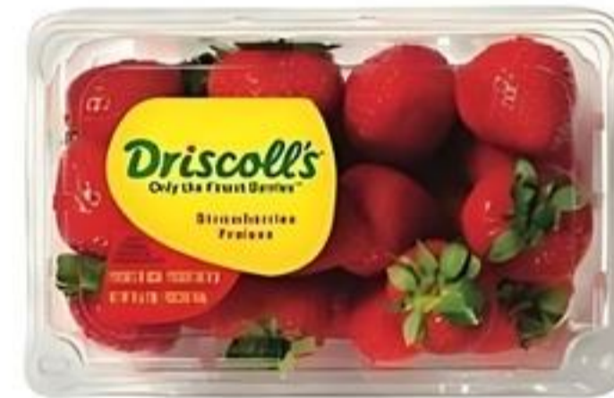
Driscoll's Fresas De Estados Unidos Env. de 16 oz. Reg. $4.89