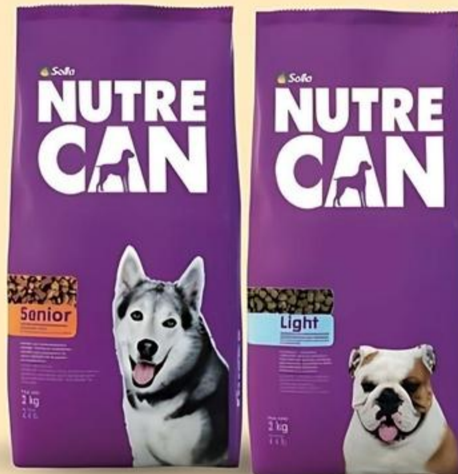
NutreCan Comida Seca para Perros Razas Medianas/Grandes, Razas Pequeñas, Cachorros Medianas/Grandes, Razas Pequeñas, Light, Senior Pqte. de 4.4 Lbs. Reg. $7.49 c/u