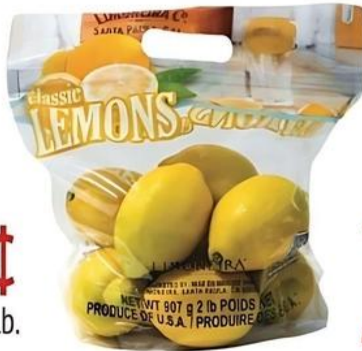
Limoneira Limón Amarillo Pqte. de 2 Lbs. Reg. $3.69 Pqte.