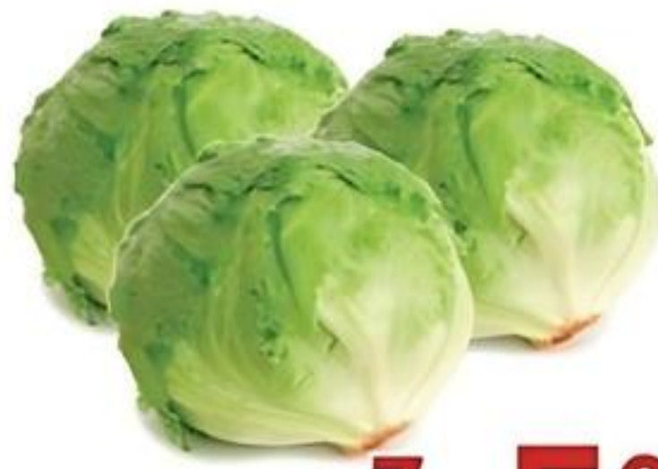
Lechuga Iceberg De Estados Unidos Reg. $2.29 c/u Especial $1.67 c/u