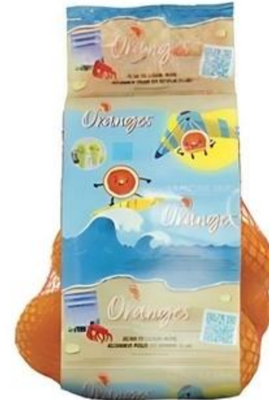
Limoneira China Nebo Pqte. de 4 Lbs. Reg. $5.99 Pqte.