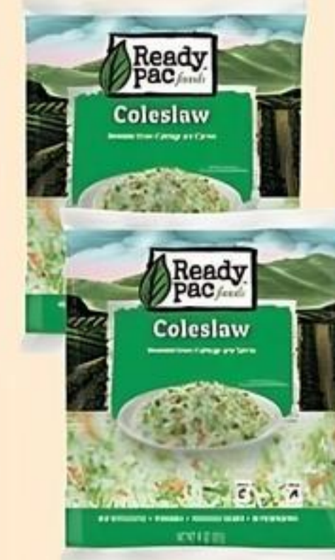
Ready Pac Foods Coleslaw Pqte. de 14 oz. Reg. $2.99 c/u Especial $2.50 c/u