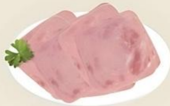
Jamón Cocido 4x4. 10% Rebanado De Estados Unidos Reg. $3.49 Lb.