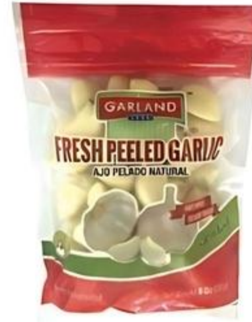
Garland Ajos Pelados De China Pqte. de 6 oz. Reg. $3.69 Pqte.