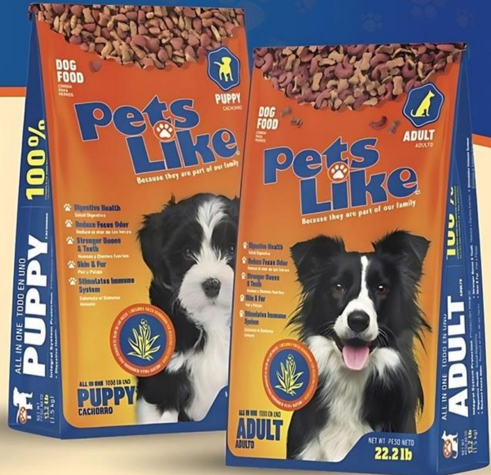
Pets Like Comida Seca para Perros Adultos/Cachorros Pqte. de 22 Lbs. Reg. $25.79 c/u