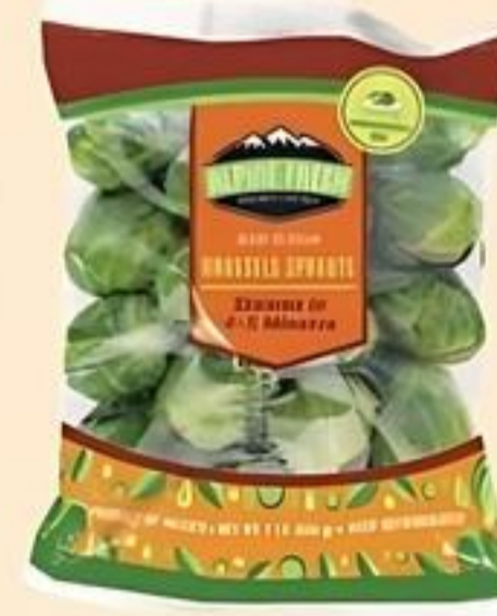
Alpine Fresh Brussels Sprouts De México/ Estados Unidos Pqte. de 16 oz. Reg. $4.99 Pqte.