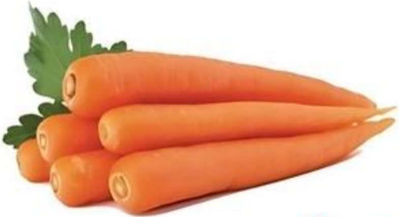
Grimmway Farms Zanahorias Pqte. de 1 Lb. Reg. $1.39 Pqte.