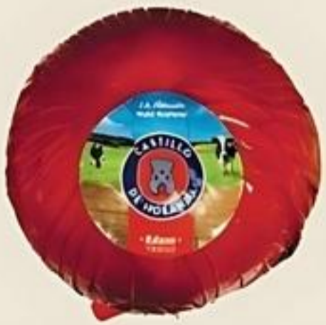
Castillo Edam Queso de Bola Tierno. Entero Holandés Reg. $5.99 Lb.