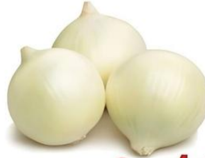
Cebollas Blancas De Estados Unidos Pqte. de 2 Lbs. Reg. $2.99 c/u Especial $2.00 c/u