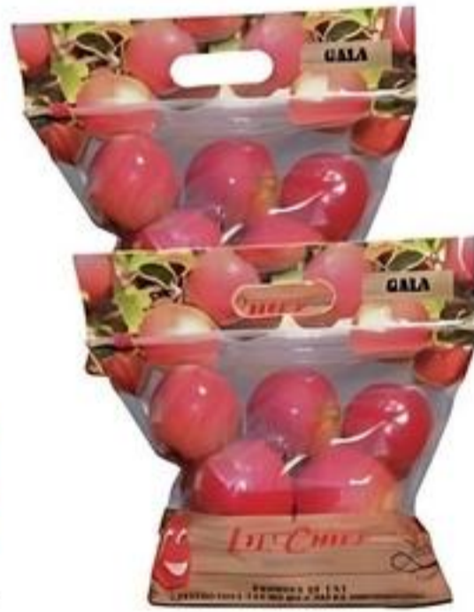
LIL' Chef Manzanas Empire, Gala, Red Delicious De Estados Unidos Pqte. de 2 Lbs. Reg. $3.39 c/u Especial $2.50 c/u