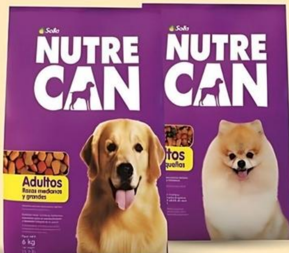
NutreCan Comida Seca para Perros Razas Medianas y Grandes, Razas Pequeñas Pqte. de 13.2 oz. Reg. $18.29 c/u