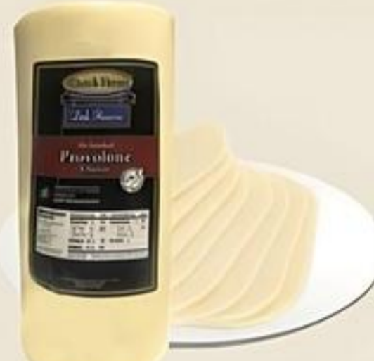
Dutch Farms Provolone Cheese Rebanado Reg. $5.49 Lb.