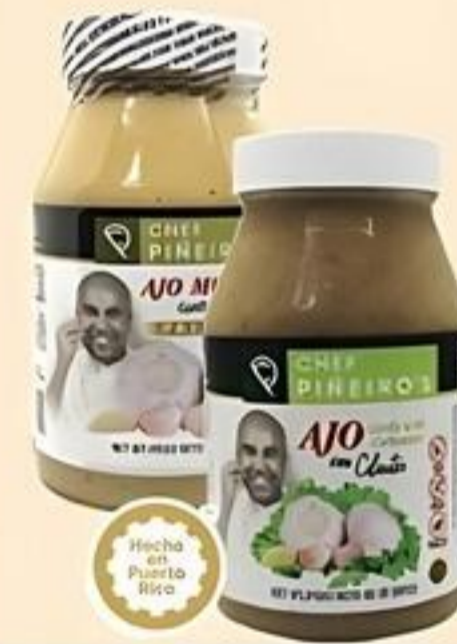
Chef Piñeiro's Ajo Variedad Env. de 32 oz. Reg. $4.99 c/u