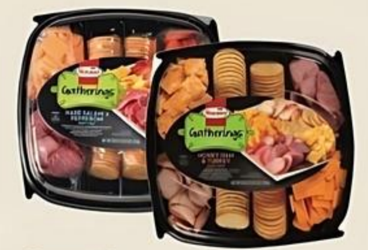
Hormel Party Tray Ham & Turkey, Hard Salami Pepperoni Env. de 28 oz. Reg. $14.99 c/u