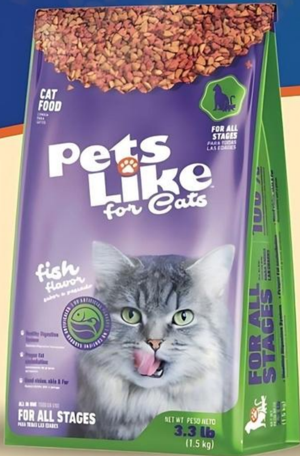
Pets Like for Cats Comida Seca Pqte. de 3.3 Lbs. Reg. $5.39