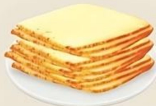
Dutch Farms Muenster Cheese Rebanado Reg. $5.49 Lb.