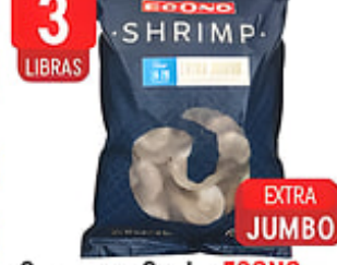
3 LIBRAS Camarones Crudos ECONO EXTRA JUMBO 16-20 ct. por lb. Cong. / Indonesia Pqte. de 3 lbs. Reg. $19.99 pqte.