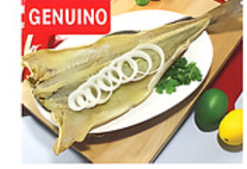
GENUINO Penca de Bacalao Genuino ECONO Bajo en Sal / Canadá Reg. $11.99 lb.