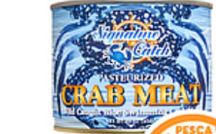
Carne de Jueyes Signature Catch Pausterizada / Refrigerada Indonesia / Lata de 1 lb. Reg. $14.99 lata