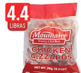
4.4 LIBRAS Mollejas de Pollo Mountaire Cong. / Estados Unidos Pqte. de 4.4 lbs. Reg. $6.99 pqte.