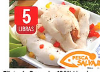
5 LIBRAS Filete de Carrucho 100% Limpio Cong. / Honduras o Nicaragua Caja de 5 lbs. Reg. $9.99 caja