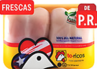
FRESCAS Pechugas de Pollo Deshuesadas To-Ricos Sin Piel / Frescas Puerto Rico Reg. $4.99 lb.