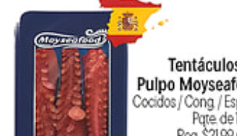
Tentáculos de Pulpo Moyseseafood Cocidos / Cong. / España Pqte. de 12 oz. Reg. $21.99 pqte.