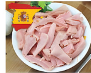
Cuajo de Cerdo Cong. / España Reg. $2.99 lb.