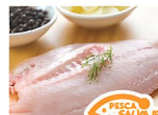
Filete de Chillo Cong. / Surinam Reg. $14.99 lb.