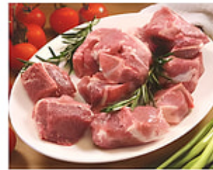
Carne de Cerdo para Freír Con Hueso / Cong. Estados Unidos o Canadá Reg. $3.49 lb.