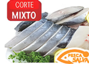
CORTE MIXTO Sierra Rebanada Corte Mixto Cong. / Surinam o México Reg. $4.99 lb.