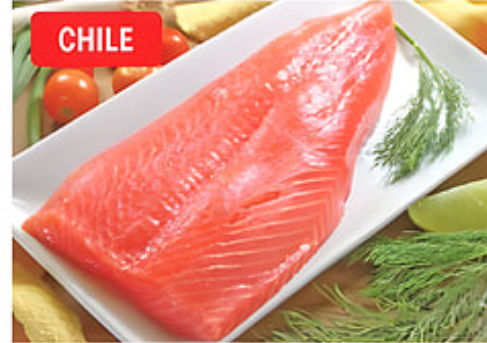
CHILE Filete de Salmón (Penca) Cong. / Chile De 1 a 2 lbs. Reg. $9.99 lb.