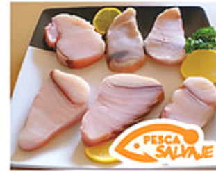
Porciones de Tiburón (Sin Piel) Cong. / Taiwan / De 8 oz. Reg. $4.99 lb.