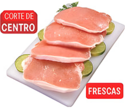
CORTE DE CENTRO Chuletas de Cerdo Deshuesadas Corte de Centro Frescas / Estados Unidos Reg. $3.99 lb.