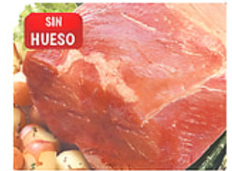
SIN HUESO Pernil de Cerdo Delantero Sin Hueso / Cong. / Brasil Reg. $2.99 lb.