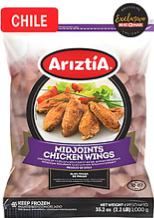
CHILE Alas Medias (Midjoints) de Pollo Ariztia Cong. / Chile Pqte. de 22 lbs. Reg. $10.99 pqte.