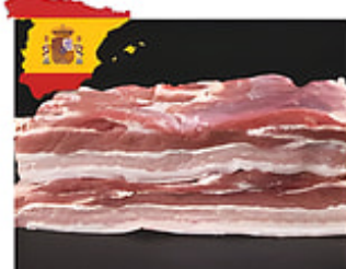
Pork Belly Cong. / España Reg. $5.99 lb.