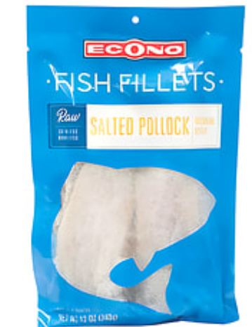
Filete de Abadejo (Pollock) ECONO Salado / China Pqte. de 12 oz. Reg. $4.99 pqte. Esp. $2.50 pqte.