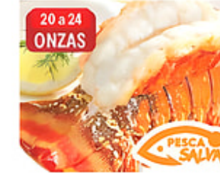
20 a 24 ONZAS Rabo de Langosta Cong. / Turcos y Caicos De 20 a 24 oz. Reg. $24.99 lb.