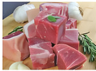
Pernil de Cerdo Entero Trozado para Freír Con Hueso / Cong. Estados Unidos o Canadá Reg. $2.99 lb.