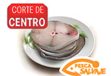
CORTE DE CENTRO Sierra Rebanada Corte de Centro Cong. / Surinam o México Reg. $5.49 lb.