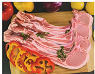
Chuletas de Cerdo Kan Kan Cong. / Canadá Reg. $3.99 lb.