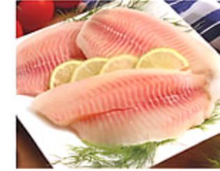
Filete de Tilapia Cong. / China Reg. $4.99 lb.