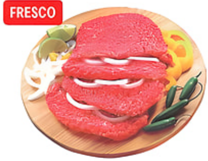
FRESCO Bistec de Res Machacado "Cubed Steak" Fresco / Brasil o Costa Rica Reg. $5.99 lb.